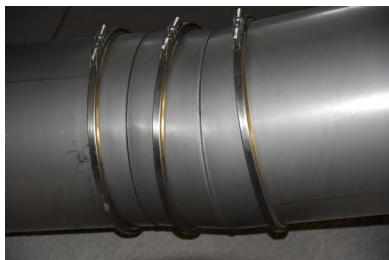
Luftleitungen aus V2A

Rostfreier Stahl besteht aus einer Stahllegierung mit einem Chromanteil von minimum 11,5%. Dieser Chromanteil bildet einen passiven Belag aus Chromoxid, welcher vor weiterer Oberflächenkorrosion schützt und verhindert, dass die Korrosion in die innere Materialstruktur vordringt. Rostfreier Stahl kann sich beim Erhitzen verfärben (z.B. entlang der Schweißnaht, Fremdeisen oder Eisenmischkristallen). Die Produkte aus Edelstahl sind nicht passiviert.